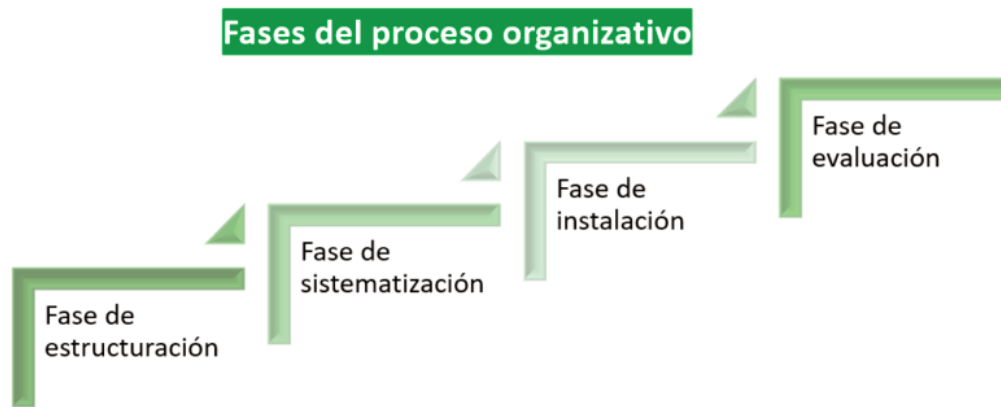
Figura 2. Fases del proceso organizativo. Elaboración propia.

Estas fases se expresan ordenadas de forma lógica, aunque cabe señalar que, en la práctica profesional, enfermeras y enfermeros gestores las realizan diferenciada o simultáneamente en la medida del tipo y momento en el que se encuentra su responsabilidad organizativa. En muchas ocasiones, la experiencia del profesional hace que algunas de ellas no se identifiquen de forma explícita, sino que se produzcan con tanta naturalidad que parezcan un continuo inseparable. No obstante, es deseable que si se va a iniciar desde