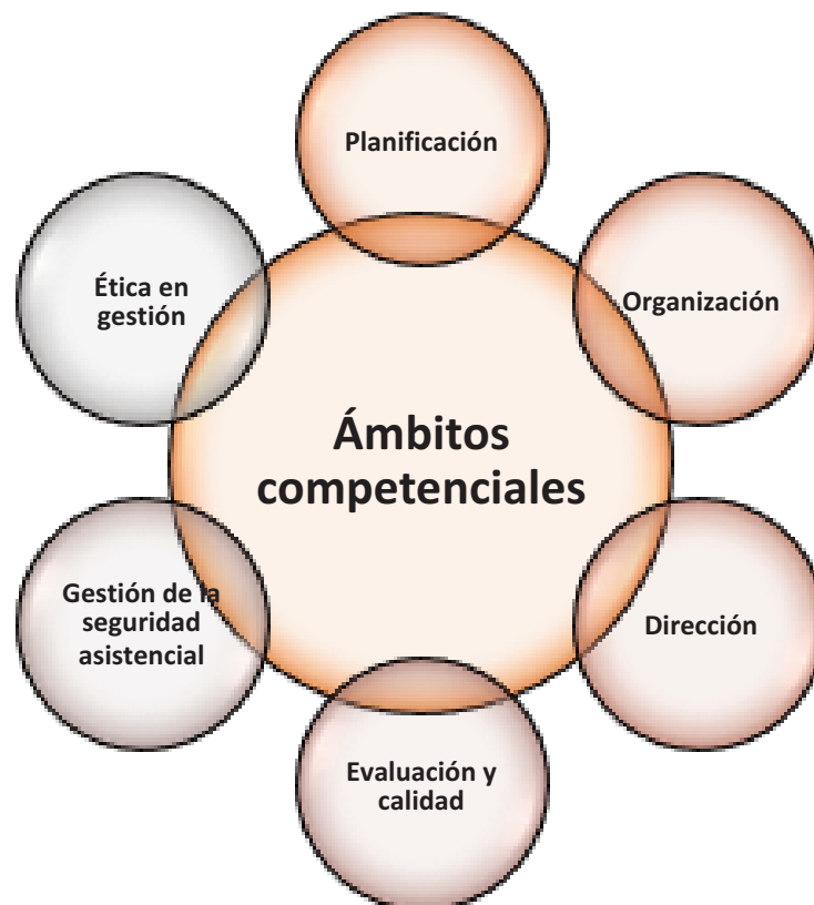
Figura 1. Ámbitos competenciales de desarrollo para las enfermeras gestoras y líderes en salud. Elaboración propia.

Por ende, una gran mayoría de enfermeras de todo el mundo han trabajado sin descanso en unas condiciones terriblemente estresantes, desbordadas por la presión y circunstancias propias de la pandemia SARS-CoV2 y no solo han tenido que responder adaptando inmediatamente su práctica cuidadora a ello, sino que en lo que a enfermeras gestoras se refiere, ellas y ellos han tenido que reorganizar toda su actividad, recursos materiales, conocimiento, tiempos y equipos humanos y materiales adaptándolos a la crítica realidad. Han tenido